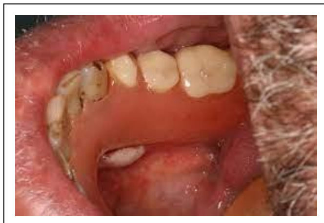
Figura 4: Úlcera traumática.