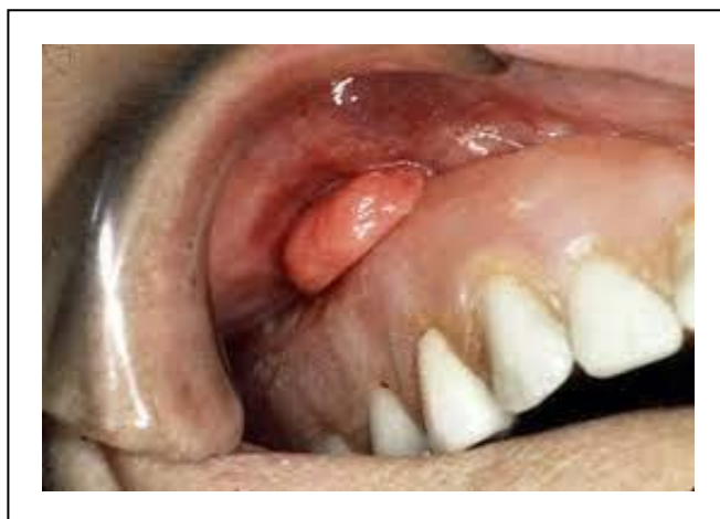
Figura 3: Hiperplasia Fibrosa Inflamatória.