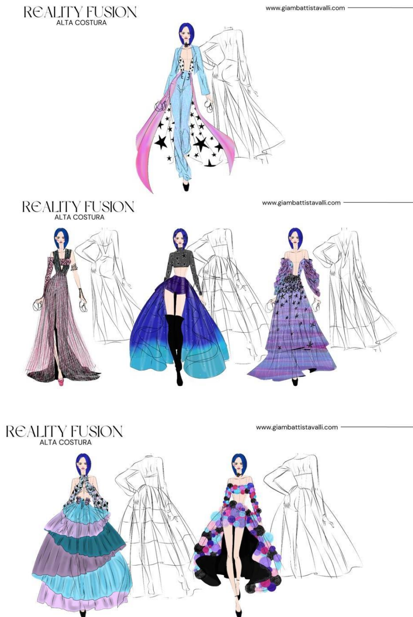
Figura 3: Looks do bloco Reality Fusion

representam a jornada emocional dos personagens ao se verem em um confronto; Coraline VS. Beldam. Os vestidos fluidos; cheios de detalhes e os conjuntos elegantes e marcantes exalam uma sensação de feminilidade e poder 5 , enfatizando as forças simultâneas de ambos os lados da guerra, encontradas nos filmes de fantasia, principalmente em Coraline e o Mundo Secreto.