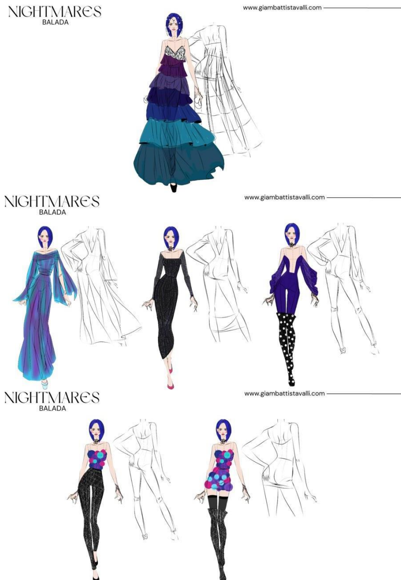
Figura 2 Looks do bloco Nightmares

universo cinematográfico. As texturas ricas e os detalhes intrincados dessas peças proporcionam uma experiência visual única, convidando os espectadores a mergulharem em um mundo de supostos sonhos, logicamente, remetendo ao mundo criado por Beldam para atrair e conseguir prender Coraline ali, numa realidade colorida, rica em flores, animais, itens caros, insetos amigos, e cenários formidáveis. 4