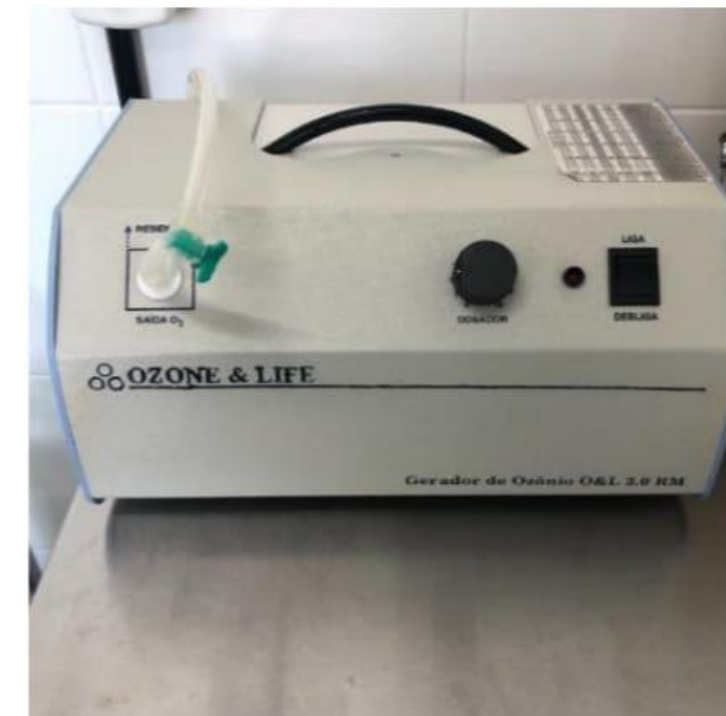
Figura 2. Gerador de ozônio Ozone & Life

Na aplicação geralmente é feita por via retal, devido a facilidade de aplicação. Em alguns casos são utilizados o óleo de girassol ozonizado e um gerador de ozônio (figura 2), onde o paciente permanece por 40 minutos.