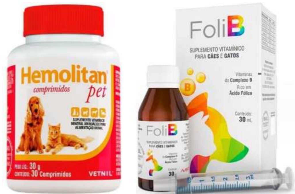
FIGURA 1: Exemplos de suplementos vitamínicos utilizados em pets