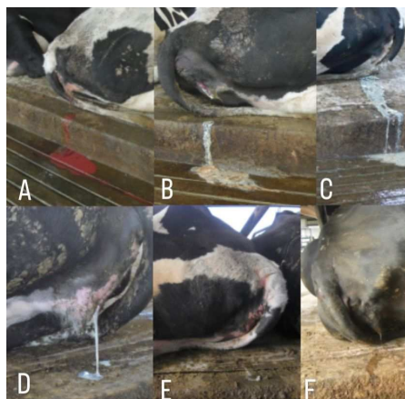
Figura 1: Aspecto das secreções cérvico-vaginal após o parto: A) sanguinolenta; B) sanguinopurulenta; C) purulenta; D) mucopurulenta; E) estriações de pus; F) cristalina.

A metrite é um processo inflamatório que acontece no útero, classificada em metrite puerperal e metrite clínica onde ambas se apresentam pós-parto, afetando diferentes camadas no útero, sendo elas mucosa, muscular e serosa, acompanhada por involução uterina retardada (MARTINS, et al. , 2011; SILVA, 2020). A metrite puerperal apresenta sinais de doenças sistêmica, mais comumente febre e toxemia nos animais afetados e consequentemente redução na produção de leite, e é caracterizada principalmente pela presença de secreções fétidas, aquosas avermelhada ou marrom (sanguinolenta); já a metrite clínica, não apresenta sinais de doença sistêmica, sendo qualificada por secreção vaginal purulenta com odor brando (imagem C - figura 1) (MARTINS, et al. , 2011).