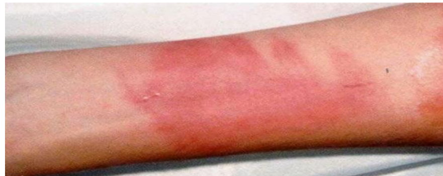
Imagem 1: Queimadura de primeiro grau

A maioria destas queimaduras obteve profundidade 1 e 2. Nestes casos ambos causam vermelhidão e formação de bolhas, inchaço e dor (grau 2). Sendo sugerido, no grau 2, um atendimento de primeiro socorro e encaminhamento ao hospital (1) .