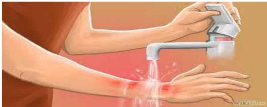
Imagem 3: Uso de água corrente em queimaduras.

Atendimento: O atendimento de primeiro socorro consiste em 3 etapas principais: 1- parar o processo de lesão, 2- resfriar local lesionado e 3- cobrir o ferimento com pano limpo e úmido (1) .