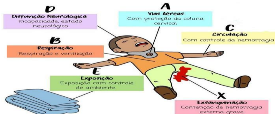
Imagem 3: XABCDE do trauma

O atendimento de primeiro socorro consiste em 3 etapas principais: 1) avaliação de cena; 2) estancamento do sangue; e 3) ligação urgente para a emergência.